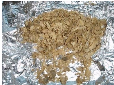
Exemples de prélèvements